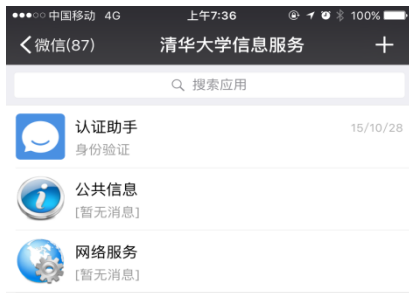
图 3 点击“认证助手”