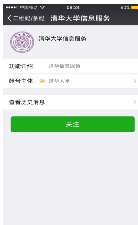
图 2 关注“清华大学信息服务”