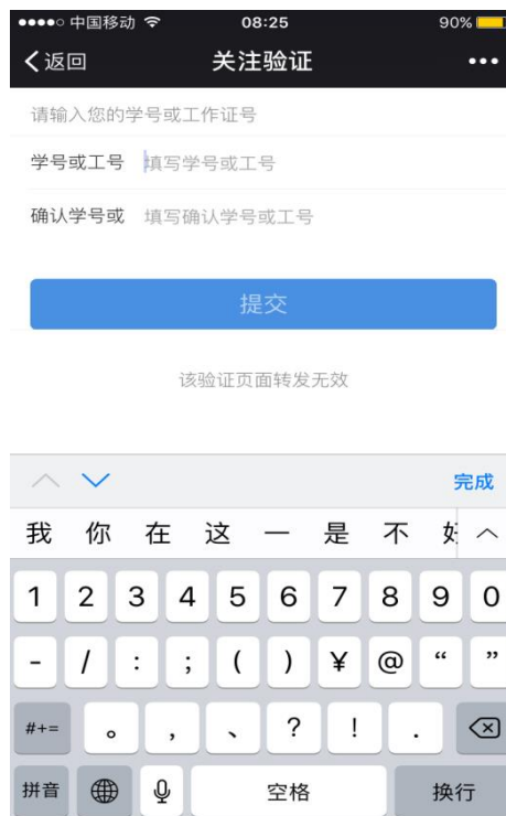
图 5 按提示输入两遍工作证号

2) 在校师生请选择学校统一身份认证, 输入工作证号/学号、INFO 密码, 确认身份;