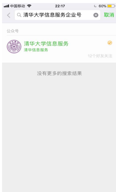
图 1 搜索“清华大学信息服务”